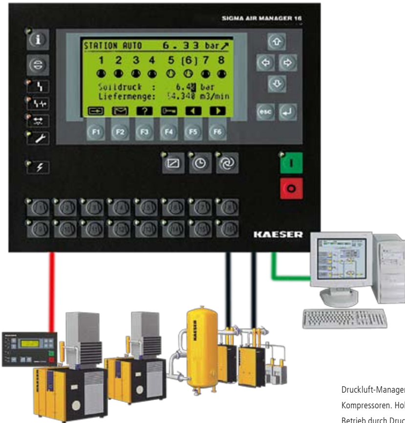
Druckluft-Managementsystem für den Einsatz mehrerer Kompressoren. Hohe Wirtschaftlichkeit und zuverlässiger Betrieb durch Druckbandsteuerung und Erfassung aller relevanten Maschinen- und Gerätedaten.

Es gibt einen guten Grund sich mit der Ökonomie einer Druckluftanlage zu beschäftigen: Geld!