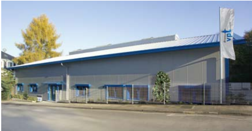
Unser Sitz auf der Margaretenstraße in Wuppertal

Wir sitzen ganz in Ihrer Nähe – in Wuppertal.